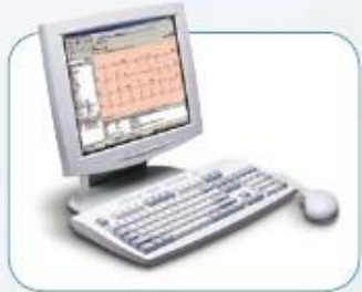
Estación de trabajo CardioPerfect™ de Welch Allyn